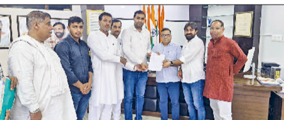
सोनीपत। उपायुक्त को ज्ञापन सौंपते हुए मोर्चा के प्रतिनिधि।

मनोहर लाल खट्टर से किसानों की बैठक हुई, जिसमें आर्थिक नुकसान की भरपाई के लिए मुआवजा पॉलिसी लागू करने पर चर्चा हुई। इसके बाद 2 फरवरी को औचकी बाईर दिल्ली में किसान