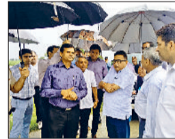
यमुना के तटीय गांवों में पहुंचे अधिकारी।

यमुना के उफान ने जिले के कई गांवों को अब भी संकट में डाल रखा है। हथिनीकुंड बैराज से छोड़े गए पानी और हालिया बारिश के चलते नदी का जलस्तर खतरनाक स्तर पर बना हुआ है, हालांकि पानी में मामूली कमी आई है जिससे कुछ राहत महसूस की जा रही है। बाढ़ग्रस्त इलाकों में प्रशासन ने बचाव और राहत कार्य तेज कर दिए हैं, वहीं कई गांवों के हालात अब भी गंभीर बने हुए हैं। खासकर टोंकी गांव में कई घरों में पानी घुस चुका है, जिससे ग्रामीणों की जान को खतरा बना हुआ है। उपयुक्त सुशील सारवान