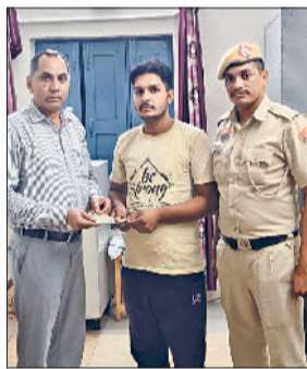
सोनीपत। युवक का ईनाम राशि देते।