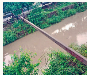
गन्नौर। गिरा बिजली पोल।

गन्नौर। मंगलवार की दोपहर 3 बजे से शाम 9 बजे तक हुई लगातार तेज बरसात ने ग्रामीण और शहरी दोनों क्षेत्रों में बिजली व्यवस्था को बुरी तरह प्रभावित कर दिया। ग्रामीण सब डिवीजन में करीब 120 पोल और 35 ट्रांसफार्मर क्षतिग्रस्त हो गए, जिससे लगभग 70 लाख रुपये का नुकसान आंका गया है। वहीं शहर में भी 10 पोल और 5 ट्रांसफार्मर खराब होने से 3 लाख 50 हजार का नुकसान हुआ। वीएसटी के पास अंडरग्राउंड केबल बाक्स फटने से मंगलवार शाम करीब 4 बजे शहर की कई कालोनियों और बाजारों में बिजली गुल हो गई। निगम की टीम को बुधवार दोपहर करीब ढाई बजे फाल्ट मिला, जिसके बाद ही शहर में बिजली आपूर्ति बहाल हो सकी। लोगों ने लगभग 22 घंटे की परेशानी के बाद राहत की सांस ली।