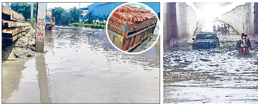
गन्नौर। लायंस कम्युनिटी केंद्र के कार्यालय में भरा बरसात का पानी। राजतू गद्दी के पास अंडरपास में भरे पानी से निकलते वाहन।

लगातार बारिश से न केवल सड़कों और गलियों में जलभराव हो गया बल्कि कई घरों के भीतर भी पानी घुस आया। देर रात तक लोग बाल्टियों और मोटरों की मदद से अपने घरों से पानी निकालते नजर आए।